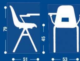
SH16 Sedia fissa sovrapponibile con due braccioli e scrittoio nero. Stackable fixed armchair with black writing board.