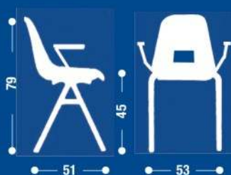
SH13 Sedia fissa con braccioli sovrapponibile. Stackable fixed armchair.