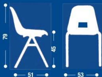
SH10 Sedia fissa sovrapponibile. Stackable fixed chair.