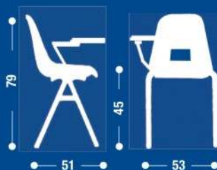
SH15 Sedia fissa sovrapponibile con un bracciolo e scrittoio nero. Stackable fixed chair with armrest and black writing board.