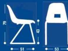
SH12 Sedia Telaio a slitta Armchair on wheels