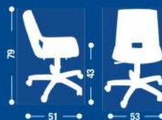
SH11 Sedia GIREVOLE Chair on wheels