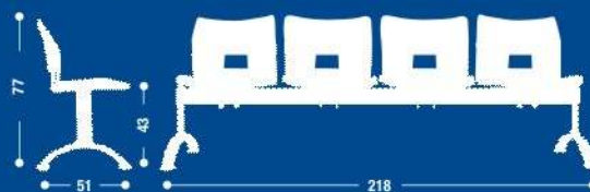
Panca a 4 posti Four seater bench