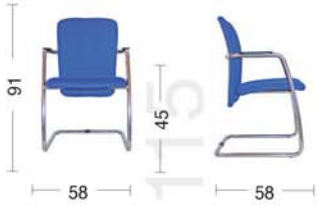
KL 27 Sedia fissa con braccioli Fixed armchair