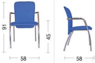
KL 28 Sedia fissa con braccioli Fixed armchair