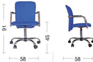
KL 24 Sedia girevole con braccioli Swivel armchair