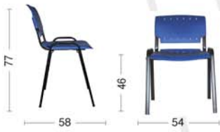
GA40 Sedia fissa. Fixed chair