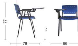
GA46 Sedia fissa con due braccioli e scrittoio nero. Fixed armchair with black writing board.