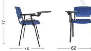
GA45 Sedia fissa con bracciolo e scrittoio nero. Fixed chair with armrest and black writing board.