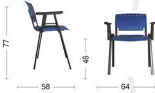
GA43 Sedia fissa con braccioli. Fixed armchair.