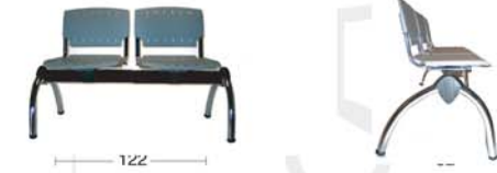
Panca a 2 posti. Two seater bench.