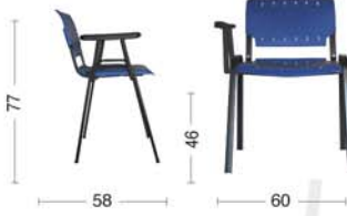
GA42 Sedia fissa con bracciolo. Fixed chair with armrest.