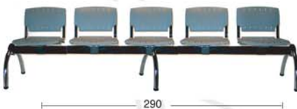
Panca a 5 posti. Five seater bench.