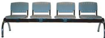
Panca a 4 posti. Four seater bench.