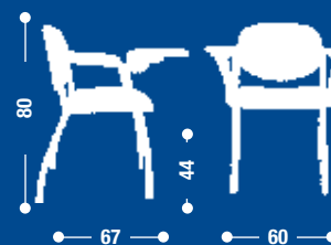
BK8 Sedia fissa con due braccioli e scrittoio nero. Fixed armchair with black writing board.