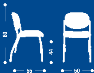
BK5 Sedia fissa. Fixed chair.